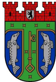
Treptow-Köpenick (seit 2001)